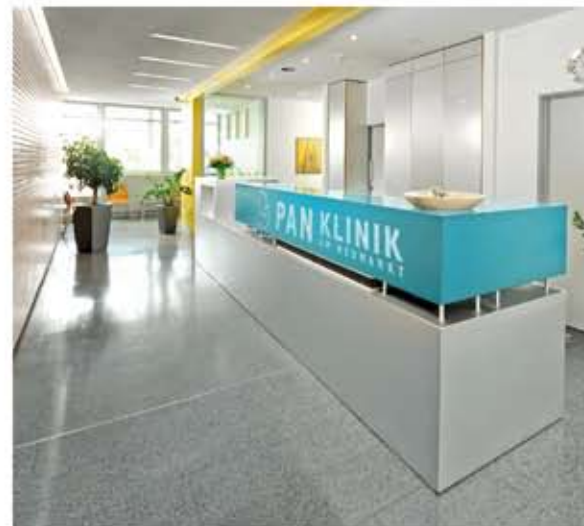
Empfangsbereich der PAN-Klinik

Aus diesem Grund begann ich eine umfassende Ausbildung in Traditioneller Chinesischer Medizin (TCM) bei der SMS (societas medicinae sinensis).